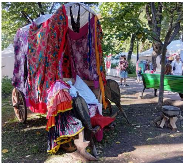
Foto 9. Foalele ( pișota ) și ilăul ( coața ) cu vârful ascuțit – instrumentele fierăritului itinerant practicat în „vremurile trecute” de romii ciocănari, utilizate ca decor artizanal contemporan, asociat culturii tradiționale a romilor.

ferate» – specifice fiecărei categorii ale clienților. În schimb, în spațiul virtual – marfa nu poate fi testată și prețul nu poate fi negociat, iar clientul, după livrare, deseori rămâne decepționat de calitatea produselor recepționate. Spre regret, actualmente, în epoca de tranziție ireversibilă de la «progresul industrial» spre «progresul digital» – meseria de fierar, treptat devine o «meserie neprofitabilă: practică diminuată și fragmentară». Produsele fierăritului confecționate manual, nu mai sunt solicitate «ca în vremurile trecute», deoarece există o varietate suprasaturată de produse gospodărești fabricate mecanic, care pot fi procurate în centrele comerciale. Instrumentele fierăritului sunt utilizate adeseori la festivalurile etnoculturale – ca decor artizanal contemporan, asociat culturii tradiționale a romilor» (Foto 9).