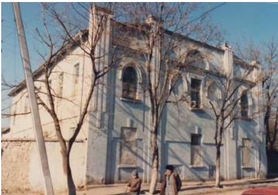
Fig. 5. Здание бывшей синагоги, принадлежавшей Лейбу Резник в г. Оргеев.