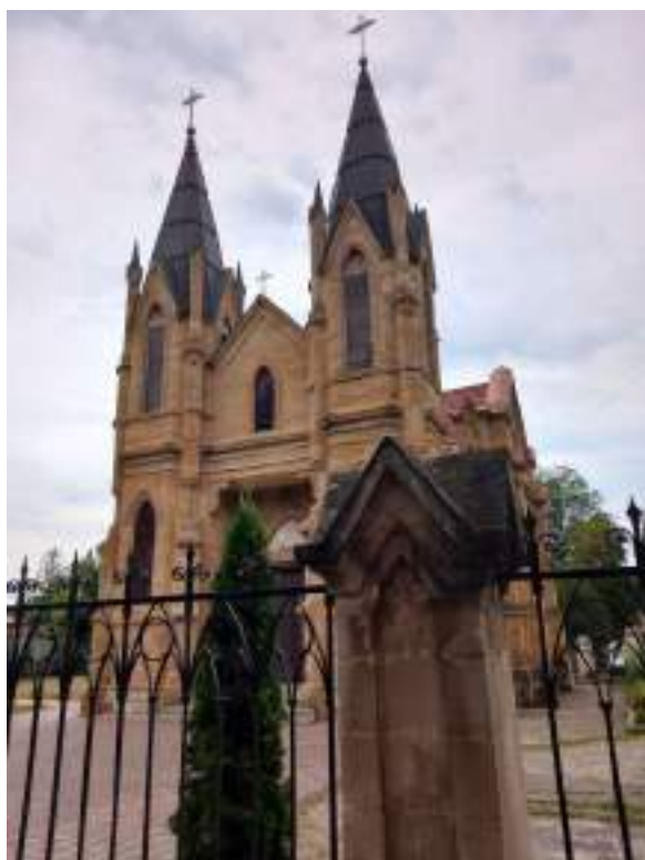
Fig. 4. Здание Оргеевского Католического Костела после реставрации.