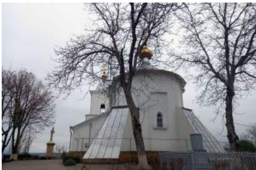
Fig. 2. Церковь Святого Дмитрия в г. Орхееве.