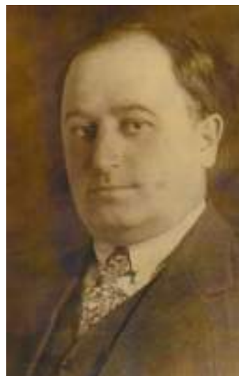
Fig. 8. Герш Вайншток - владелец имения Бологан- Иванос.