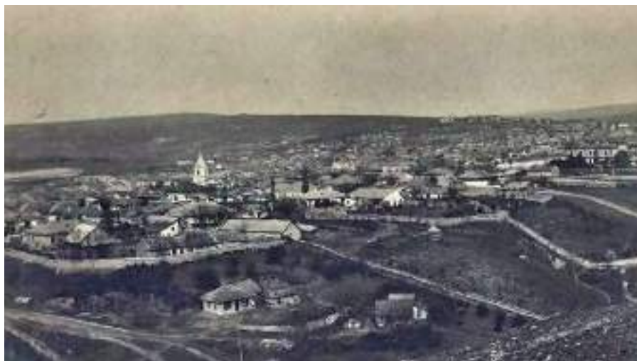
Fig. 1. Вид г. Орхеев в XIX-XX вв. ( https://www.facebook.com/orhei.streetsandfaces/?locale=mt_MT ).