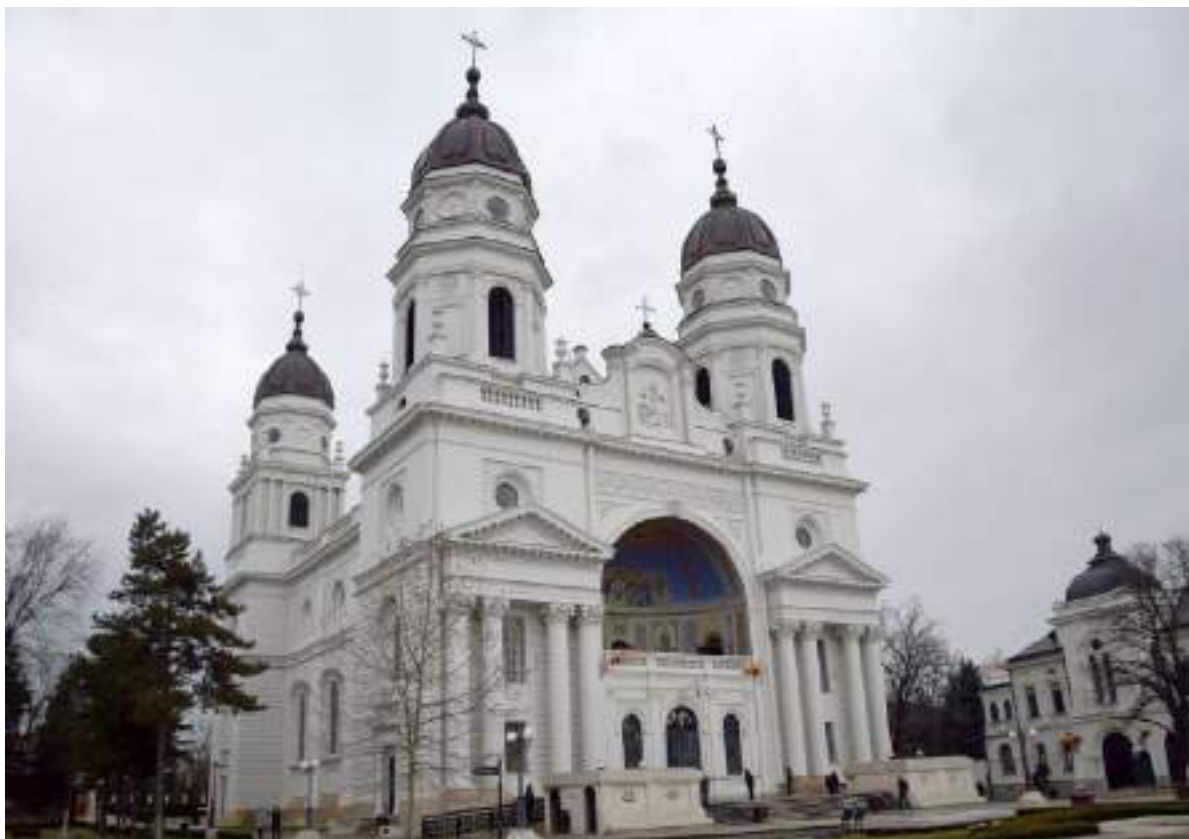
Fig. 10. Catedrala Mitropolitană din Iași ( https://www.monitorulbt.ro/localbt/2022/02/02/catedrala-mitropolitana-iasi-si-a-sarbatorit-hramul-istoric/ ).