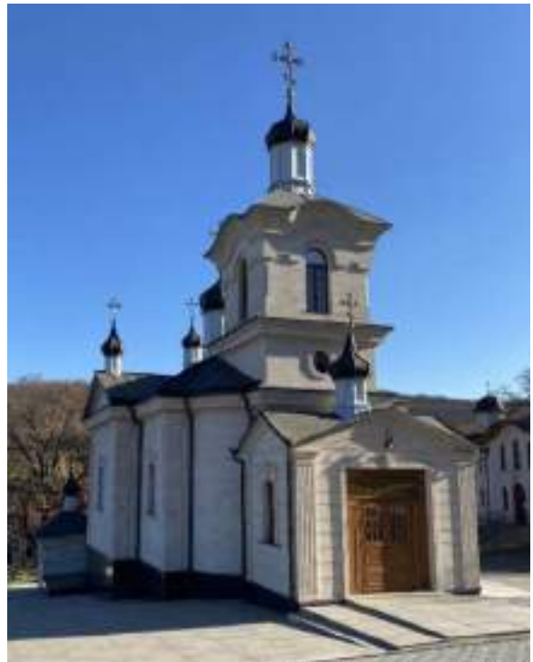
Fig. 2/2. Biserica Sf. Gheorghe, imagine din 2025.