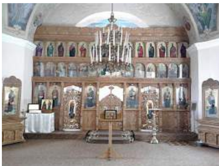
Fig. 16. Iconostasul Bisericii Sf. Gheorghe cu fragmente de frescă, 2012.