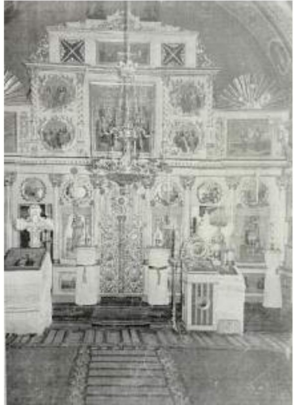
Fig. 3. Iconostasul Bisericii Sf. Gheorghe, din anii 50 ai sec. XX.