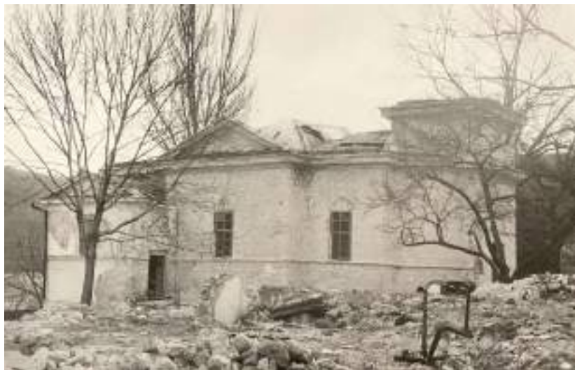
Fig. 4. Vedere exterioară a Bisericii Sf. Gheorghe , Vedere exterioară a Bisericii Sf. Gheorghe , ante 1991.