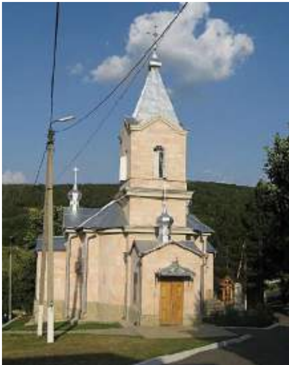
Fig. 2/1. Biserica Sf. Gheorghe, imagine din 2015.