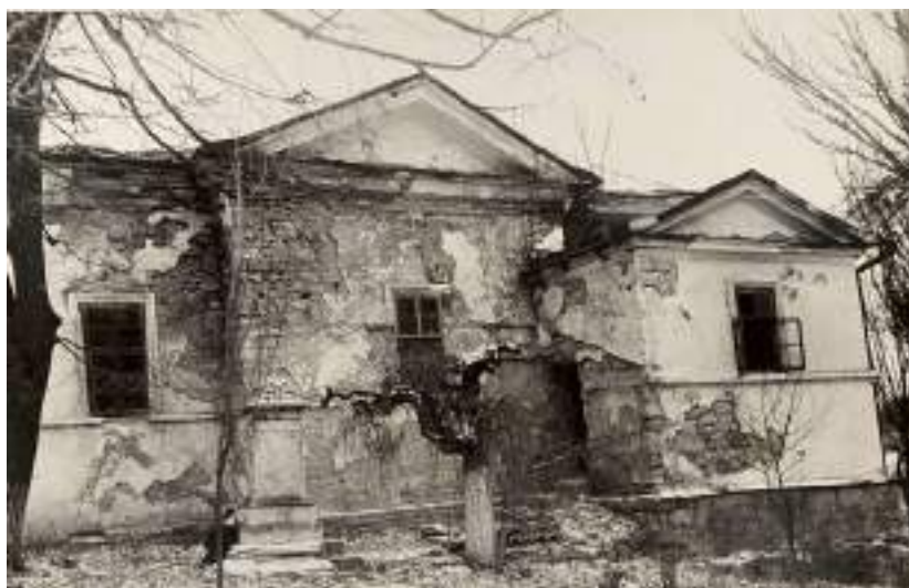
Fig. 5. Vedere exterioară a Bisericii Sf. Gheorghe , ante 1991.