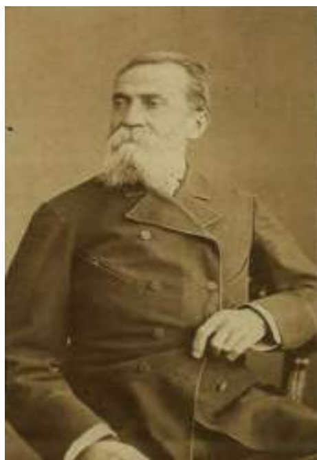
Fig. 15. Gheorghe Tattarescu (1818-1894)