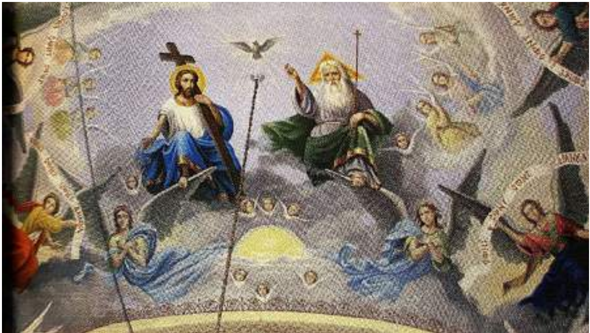
Fig 9. Sfânta Treime Nou-Testamentară, pictură murală din Biserica Sfântul Gheorghe a mănăstirii Suruceni (După Dragnev Emil, Pictura murală în mănăstirile Moldovei , în Mănăstiri și schituri din Republica Moldova . Coord. Andrei Eșanu, Chișinău, 2013, p. 99.).