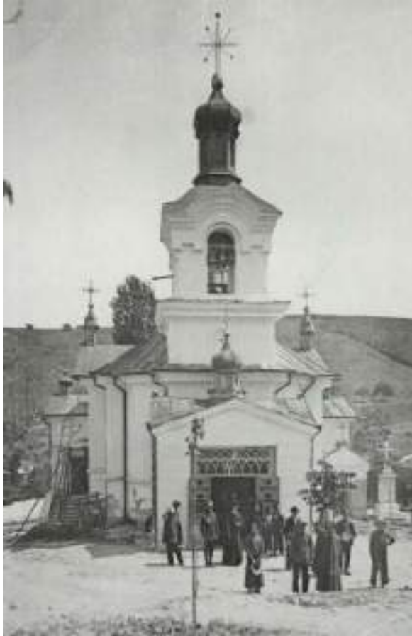
Fig. 1. Biserica Sf. Gheorghe, imagine din 1935 (Arhiva Mănăstirii Suruceni).