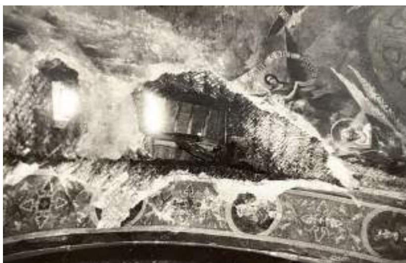
Fig. 6. Biserica Sf. Gheorghe de la Suruceni, vedere din interior cu fragmente din vechea frescă, ante 1991 (Arhivă a Mănăstirii Suruceni).